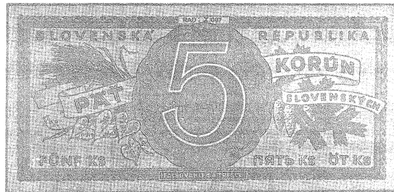
Obr. 1 - 5 Ks - b.l. (1945) - zatím zřejmě nejvzác- nější série "X" - lic. (B 67 - S 311)

I když šlo jistě o velmi zajímavou informaci, nepovažoval jsem ji v té době za vhodnou ke zveřejnění, především proto, že jsem uváděné pětikoruny neviděl a ani neznal jejich sériová čí- sla.